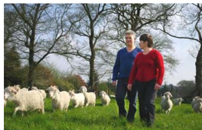
La mise à l'herbe sous haute surveillance

Noces d'or La palme d'or revient au couple d'ancêtres « Rumba », 10 ans et « Popeye », 11 ans, tri aïeux depuis bien longtemps. En octobre, alors qu'ils auraient pu fêter leurs noces d'or, ils se sont retrouvés, les vieux amants, plus amoureux qu'au premier jour. Il y avait de la namba dans l'air, ces jours-là!!