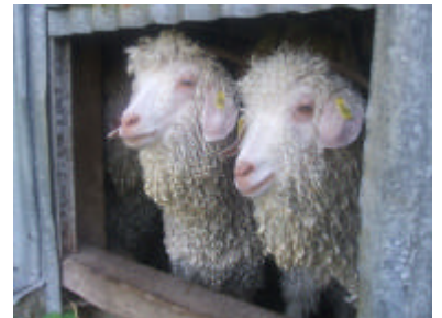
Les chèvres hésitent à mettre le nez dehors. Le foin, fait au début juin, a pourri sur le champ.

Mai, juin et juillet, trois mois de jours tristes que nous nous efforcerons d'oublier au plus vite. Foin gâché, récoltes abîmées, l'été 2007 sera celui des records de pluviométrie dans presque tous les départements de France. Au lieu d'aller à la plage, les vacanciers encapuchonnés, sont venus très nombreux nous rendre visite à la ferme. Nous les remercions vivement de leur démarche à la découverte de la Bretagne intérieure.