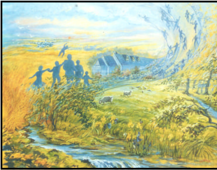
« Tourbillon de Vie » par J GEORGE (2001)

Notre prochaine animation culturelle se déroulera sur une semaine complète du 20 au 28 Octobre dans notre chalet à la Garenne Morvan.