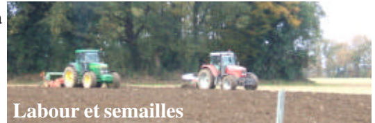
Labour et semailles

Notre vieux four à pain subit les outrages du temps. Nous l'avons protégé afin qu'il