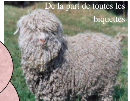
De la part de toutes les biquettes