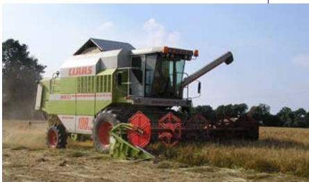
La machine coupe et avale l'orge bien mûre