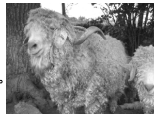
Pacha, le plus lourd doit peser près de 100 kilos