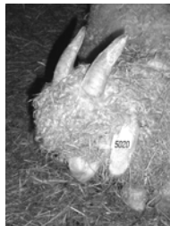
« Armor, ce n'est pas beau de boudier comme ça! »

Ils n'ont même pas 6 mois et ils commencent déjà à flirter avec les filles. La sanction est tombée, désormais la classe ne sera