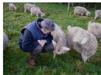
Bernard en grande conversation!

L'attente... Octobre, fut le mois de toutes les folies. Boucs et biques se sont donnés rendez-vous et « Dame nature » qui fait si bien les choses, leur a permis d'engendrer leur future progéniture. Pour voir le résultat, il faut attendre, il faut être patient. Les ventres s'arrondissent un peu plus chaque jour. Petit à petit, on devine, on imagine ces petits êtres, qui bougent à l'intérieur. Calme et repos, tel est le programme de nos futures mères qui égrènent les 150 jours de gestation rythmés par les repas et les promenades.