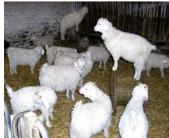
Un nouveau jeu: « Le Chevreau perché »

le terrain prêt pour les cabrioles ou tout autre sorte d'acrobatie. Et ils ont la santé ces petits! Leurs mères les autorisent à leur grimper sur le dos, à mordiller les oreilles des copains et que sais-je encore? Que diriez-vous de venir jouer avec eux?