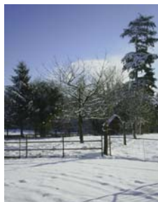
Neige en Bretagne

lampe chauffante et est venu nous prévenir. En attendant le vétérinaire, l'équipe de la tonte s'est mobilisée: on lui a enfilé un pull en mohair (pas un tout neuf, je vous rassure) et nous avons tenté de la réchauffer. Le vétérinaire arrivé lui a fait les soins appropriés et nous a invité à veiller sur elle. Dans la nuit, elle a accepté enfin de s'alimenter un peu, sa température est remontée doucement...super, on l'a sauvée, mais sur ce coup là, on a eu de la chance. Il nous a fallu calfeutrer tous les bâtiments en urgence.