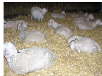
La chèvrerie vidée et repaillée