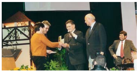
Périgueux, le 7 Octobre 2004

Il nous a été accordé dans le cadre des « Trophées de la communication ». Nous en sommes très émus et touchés. Ce trophée, nous le partageons avec nos enfants, en particulier avec