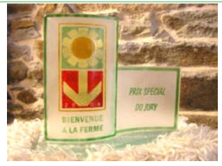
Le trophée « Prix spécial du jury »

Emilie, qui s'est montrée disponible et compétente pour nous seconder lors de la réalisation du dossier.