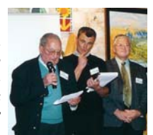
Pierre, l'animateur et les deux co-présidents du jury

Quatre pages pour parler d'agriculture et de la passion qui l'entoure, quatre pages pour laisser les amoureux de la terre s'exprimer, quatre pages pour écrire, se confier... Cette année, le concours a connu un vif succès. Il sera donc renouvelé l'an prochain. Le thème vous sera bientôt communiqué sur notre site www.mohair-pays-corlay.com , par voie de presse, par la Chambre d'Agriculture.