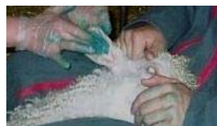
Dans les deux oreilles, le tatouage obligatoire.

Elles sont à la mode nos biquettes! Bien avant l'âge de l'émancipation, elles se font tatouer, par leurs propriétaires avec la complicité de leurs enfants. Qui l'eût cru?