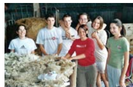
L'équipe des trieurs de mohair